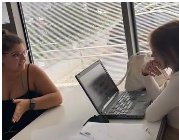
3. kép: 2. lépés - a munkadarab közös kiválasztása és tervezése